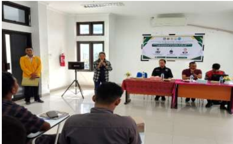
Gambar 3. Laporan oleh Ketua Panitia Kegiatan Sosialisasi dipandu oleh moderator

secara tersirat muncul saat peserta mengutarakan pada saat sesi diskusi bahwa dirinya termotivasi untuk memulai usaha di bidang olahraga, sehingga tolak ukur keberhasilan yaitu termotivasinya peserta (alumni dan mahasiswa Prodi Penjaskesrek) untuk memulai usaha di bidang olahraga.