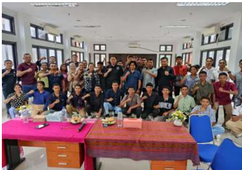
Gambar 4. Narasumber Dan Tim Dosen Penjaskesrek Melakukan Foto Bersama Dengan Para Peserta Sosialisasi Dipandu Oleh Moderator

Hasil dari Tujuan yang ketiga yaitu menyediakan forum diskusi langsung dengan narasumber wirausahawan olahraga. Hal ini dibuktikan dari terjadinya sesi diskusi tanya jawab antara peserta kegiatan dengan narasumber. Sesi diskusi tanya jawab pada kegiatan ini memakan durasi sampai kurang lebih 60 menit. Indikator tercapainya tujuan ketiga ini, tersedianya forum diskusi secara langsung antara peserta dan narasumber wirausahawan di bidang olahraga, , sehingga tolak ukur keberhasilan yaitu terjadinya diskusi aktif antara peserta (alumni dan mahasiswa Prodi Penjaskesrek) dengan narasumber Bapak Jimi W. B. Sianto, S.E., M.M.